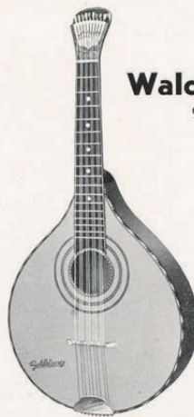
Nr. 1168/2 Hamburger Modell, mit Fächermechanik und Glassteg