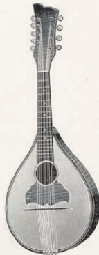
Nr. 1166/1 Thüringer Modell