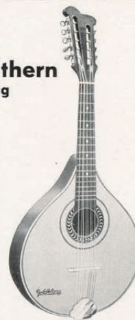
Nr. 1171/3 Hamburger Modell, mit Embergher Kopf, Glassteg, fächer Boden