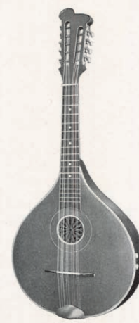
Nr. 1170/2 Großes Hamburger Modell, mit gewölbtem mehnteiligem Boden, Embergher Kopf