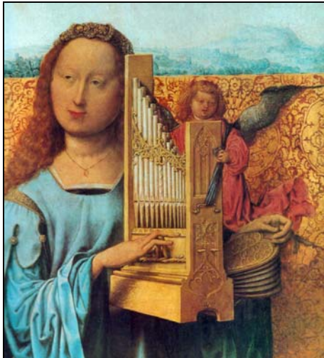
Die heilige Cäcilia mit Portativ, einer kleinen tragbaren Orgel (um 1505)